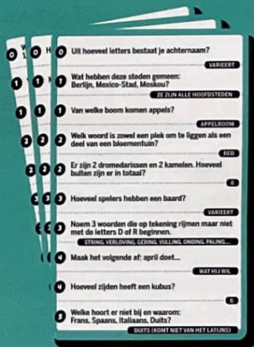
50 blauwgroene verbale kaarten (1.000 vragen)