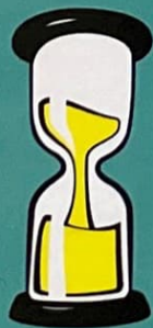
1 zandloper (30 seconden)