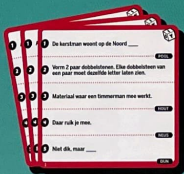
50 rode schrijfkarten (500 vragen)